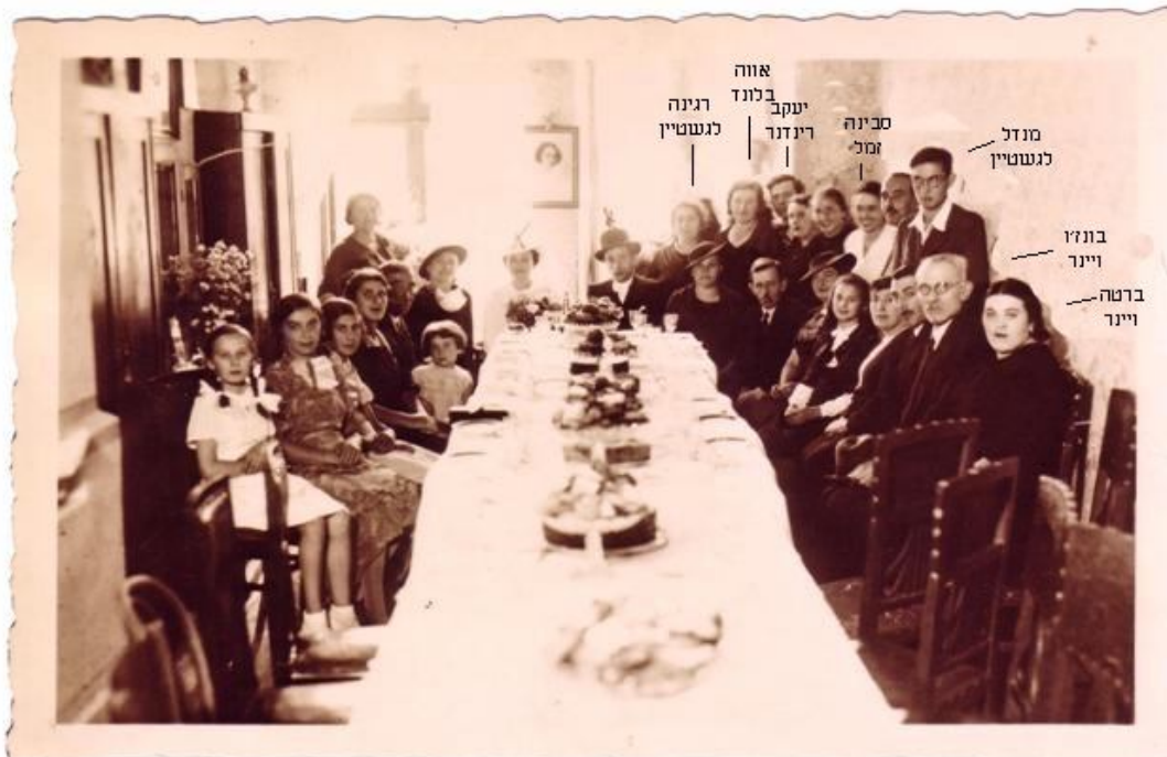
חלק ממשפחת לגשטיין בחתונה בסטורווינט