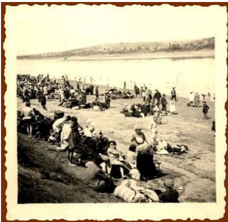
היהודים על גדת הדייניסטר

הדרך הייתה קשה. החם היה רב. גופות רבות היו לצידי הדרך. לא ניתן היה להסתתר מהשמש והרבה אנשים שהיו מותשים ממנה ומחוסר מזון ושתייה מתו. שני חיילים רומנים שמרו ללא קושי על שיירה של מאות יהודים. אוכל אספו מירקות שקטפו לצידי הדרך, מים שתו משלוליות, וגם כל זאת לאחר ששיחדו את שני החיילים באמצעות כסף ותכשיטים שחלק מהמגורשים בכל זאת לקחו איתם.