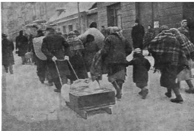
היציאה מצ'רנוביץ