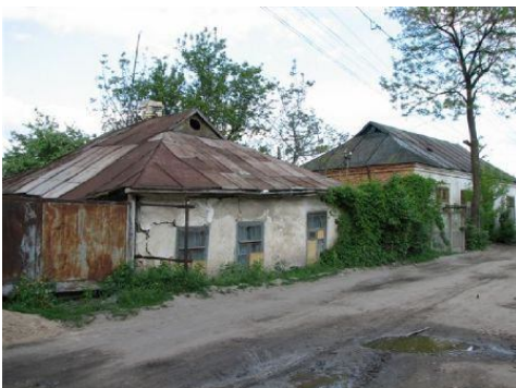
בתים בגטו ברשד

בשוק השחור המקומי ניהלו היהודים מסחר במה שהיה, אך זה היה אסור. הגרמנים ניהלו את הגטו והשומרים הרומנים מוציאים להורג את כל מי שנתפס, השיטה האהובה עליהם היתה גרירת הנתפס ברחובות הגטו ע"י אופנוע. טובה שהיתה קטנה וצנומה חופשה לגויה ע"י אשת הרב-השוטט שאצלם גרו, והייתה מתגנבת אל הכפר הרוסי שהיה ליד הגטו ומבקשת נדבות, משם ניסתה תמיד לחזור עם קצת דברי מזון. אחותה הגדולה ממנה שמרה עליה מהגרמנים ומהרומנים בעת ההתגנבות לתוך ומחוץ לגטו, במיוחד בגלל שהמעבר היה ליד תחנת המשטרה שהפרידה בין הגטו לכפר.