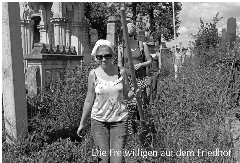
Die Freiwilligen auf dem Friedhof