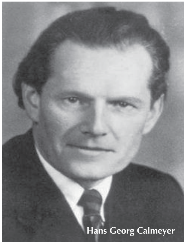
Hans Georg Calmeyer

Frage: Tat er das alles bewußt oder rettete er Juden aus Inkonsequenz?