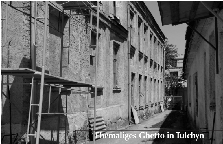
Ehemaliges Ghetto in Tulchyn