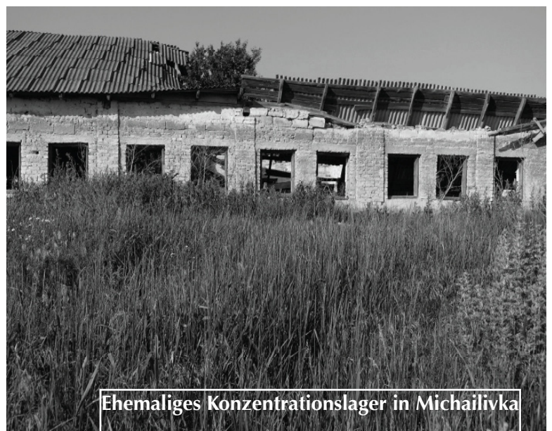
Ehemaliges Konzentrationslager in Michailiwka